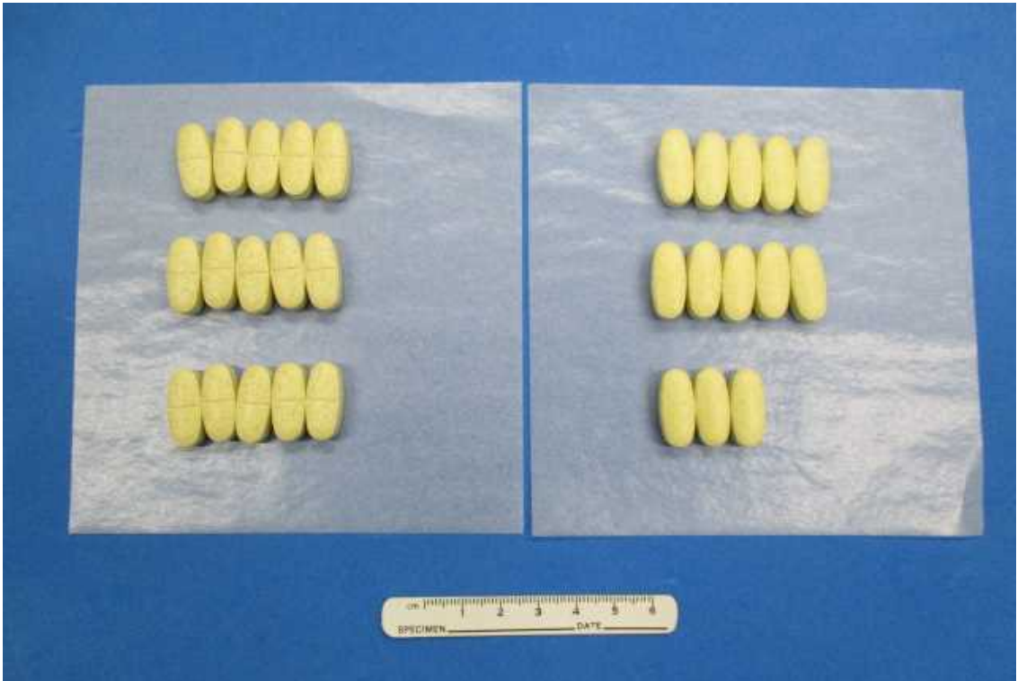
中に入っていた錠剤を薬包紙に並べた様子 (28錠入り)