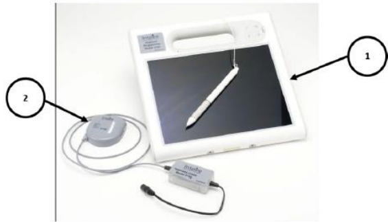
医師用プログラマ