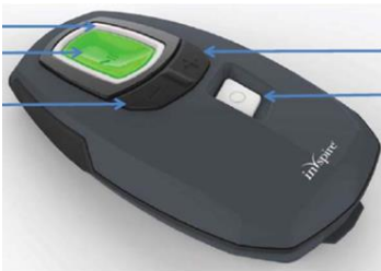
患者用プログラマ