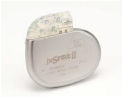
パルスジェネレータ