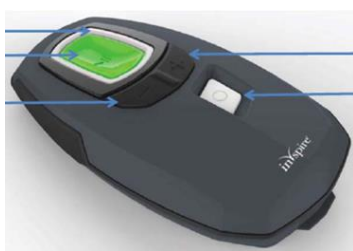
患者用プログラマ