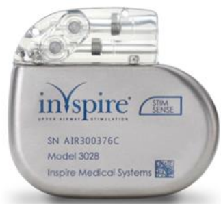
パルスジェネレータ