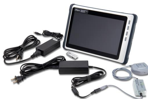
医師用プログラマ