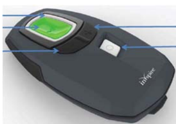
患者用プログラマ