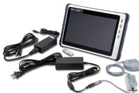
医師用プログラマ