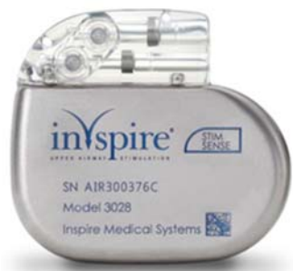
パルスジェネレータ