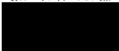
表 36 ベリフィケーション項目

また、MCB 及び／又は WCB 更新時の管理項目については、審査報告 (1) の「2.1.3 MCB 及び WCB の管理」の項に記載の項目に加え、表 36 の試験項目についても評価し、目的とする品質特性の製品が得られているかを確認することが重要であると考えます。