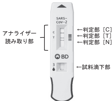
図1 テストプレート各部の名称

BD 滅菌綿棒 CF、BD 滅菌綿棒 CA、BD FLOQ 503CS01 滅菌綿棒 または BD 滅菌綿棒 Foam Tipped Applicator