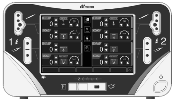
(1) 外形寸法 (W) 400 mm × (D) 435 mm × (H) 231 mm、重量：14.7kg