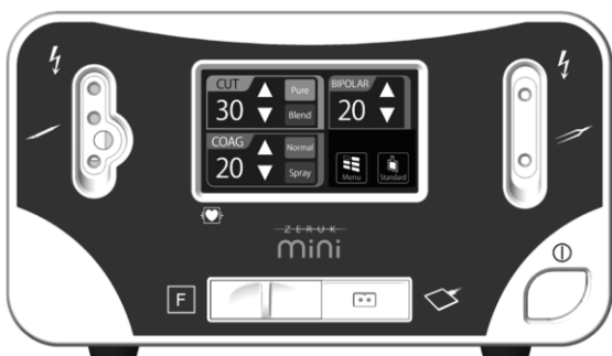
(1) 外形寸法 (W)266 mm × (D)300 mm × (H)154 mm、重量：4.1kg