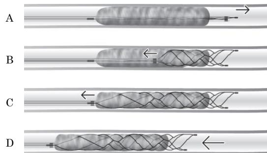
図 1. ステント送達、展開、回収

(8) ステント展開後、X線透視下で閉塞部位の血流の再開状態を確認しながら医師の判断により、ステントの完全展開の状態を一定時間維持する。