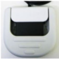
保護フラップを閉じた状態