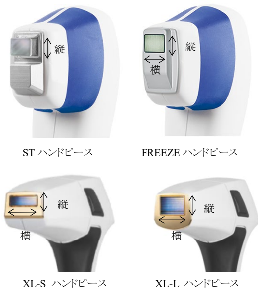
(図5)ハンドピースのレーザー出力部の縦・横の移動方向(代表例)