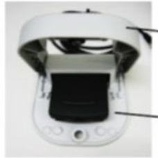
保護フラップを開いた状態